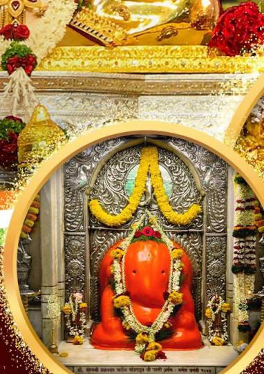
องค์อักษฏินายก

พิเศษ! ร่วมพิธี Abhishekam ที่ Dagdusheth Temple