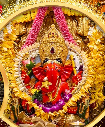
องค์สิทธินายก