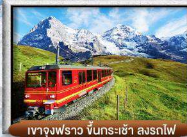
เขาจุงฟราว ขึ้นกระเช้า ลงรถไฟ