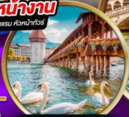
สะพานไม้ ชาเปล