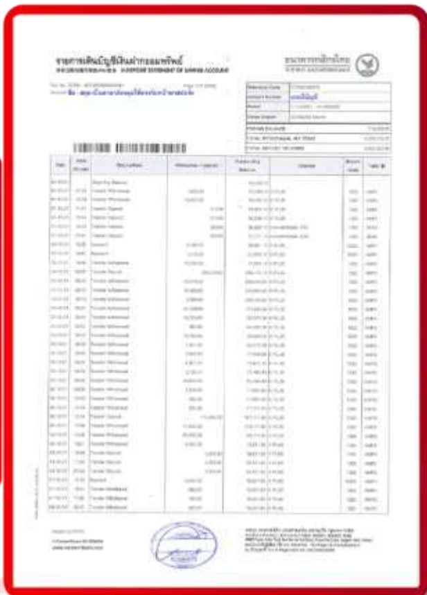
ตัวอย่าง Bank Statement ที่ผู้สมัครต้องขอธนาคาร

3.4 ปรับสมุดบัญชีธนาคารตัวจริง และเตรียมไปในวันที่ยื่นวีซ่า