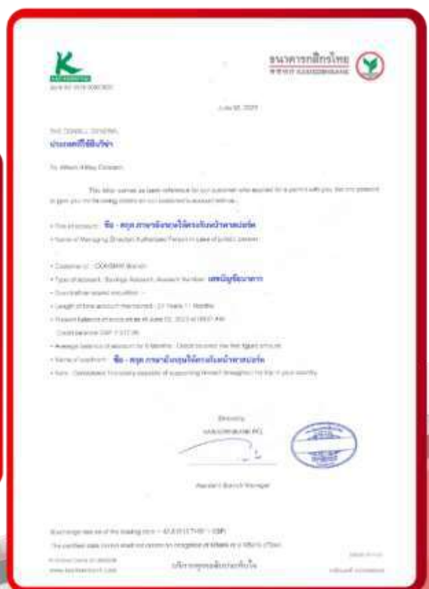
ตัวอย่าง Bank Guarantee ที่ผู้สมัครต้องขอธนาคาร