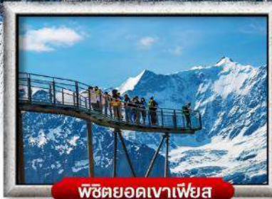
พิชิตยอดเขาเฟียส