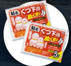
แผ่นความร้อนสำหรับ ให้ความอบอุ่นร่างกาย

2. บนเกาะโอลค์ฮอนจะมีอากาศหนาวมากต้องเตรียมกระติกน้ำเก็บความร้อนแบบพกพาได้ไปด้วย เพื่อต้มน้ำให้ความอบอุ่นร่างกาย