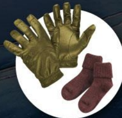
ถุงมือหนาขน แกะ กางเกงกันหนาวแบบหนา