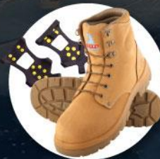
รองเท้าสำหรับเดินบนหิมะ น้ำแข็ง หรือติดที่กันลื่น Ice grippers