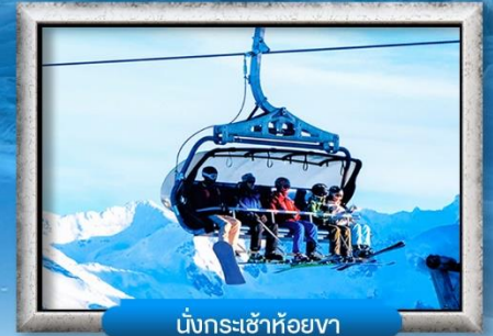
นั่งกระเช้าห้อยขา