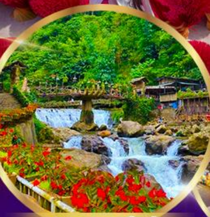
หมู่บ้านชาวเขา ถัด ถัด