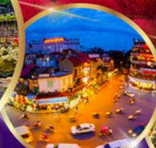
ถนน 36 สาย