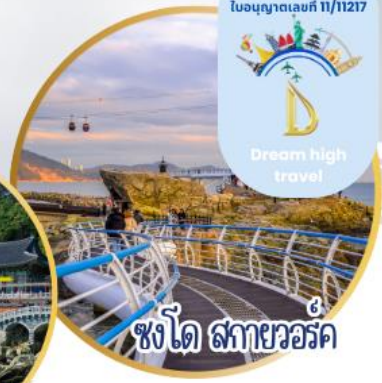
ซังโด สกายวอล์ค