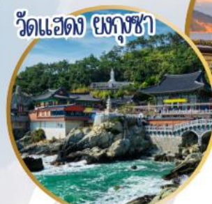
วัดแฮดง ยงจูงซา